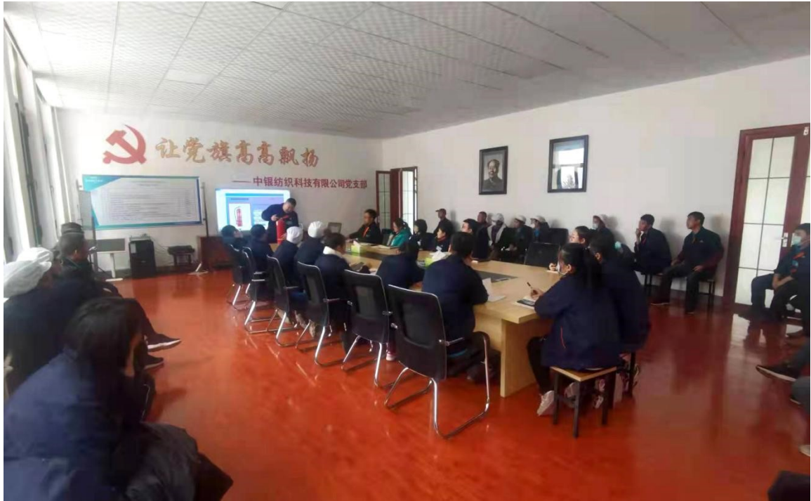
员工消防安全培训